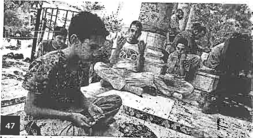
47 La grande peur des Arabes israéliens