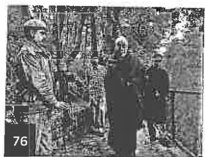
76 Entretien avec le dalaï-lama