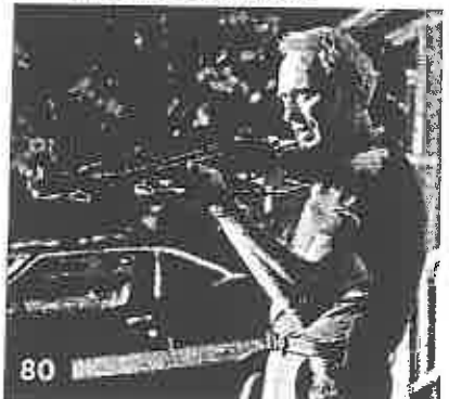
80 « Gran Torino », un film de Clint Eastwood