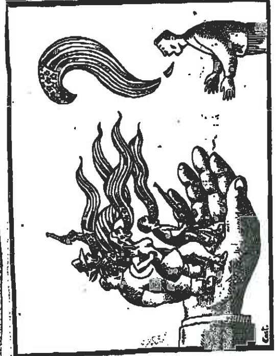
La crise pourrait être une occasion d'opportunité... à moins que l'Amérique ne se retire pour aller la chercher, ce que nous faisons nous-mêmes. Le malin qui vous observe, on ne peut pas le voir, on est prêt à tout pour le voir. C'est pour ça qu'on a des élections plus tôt qu'on ne s'y attendait. Les élections américaines sont quand on est sûr de la victoire.

« La question est de savoir si l'Amérique arrivera à se servir de l'ordinateur... » dit un cynisme... » « La question est de savoir si l'Amérique arrivera à se servir de l'ordinateur... » dit un cynisme... » « La question est de savoir si l'Amérique arrivera à se servir de l'ordinateur... » dit un cynisme... »