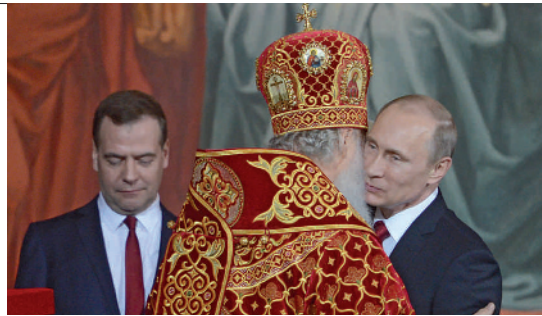
Medvedev et Poutine avec le patriarche de toutes les Russies, à Moscou, le 14 avril

Vladimir Poutine, tsar de toutes les Russies, face contre terre, devant l'autel contenant les reliques de saint Nicolas. L'homme qui fait trembler la planète, agenouillé devant l'une des manifestations les plus sensibles de l'opium du peuple. Sept ans plus tard, venu présenter à Paris son dernier opus (1), l'ancien président du Conseil italien, Massimo D'Alema se frotte encore les yeux. « En mars 2007, j'étais alors ministre des Affaires étrangères de Romano Prodi, raconte l'ex-dirigeant des Jeunesses communistes. Pour discuter énergie et relations entre l'ENI et Gazprom, lors du traditionnel sommet avec la Fédération de Russie, nous avons choisi Bari, dans les Pouilles. »