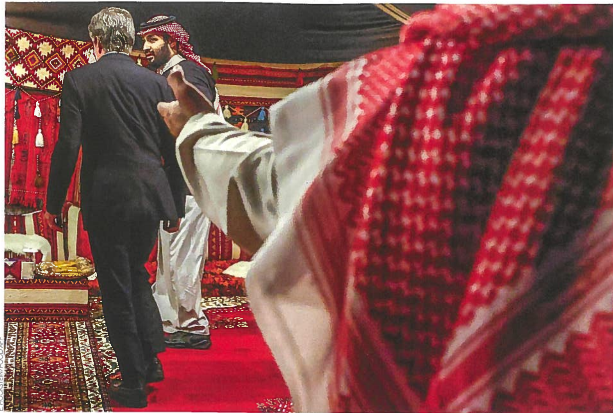
« MBS [ici, avec le secrétaire d'Etat américain, Antony Blinken] mène une réforme sociale et économique inédite dans le Golfe. »

de l'air. Tout a changé après ça. Non seulement l'Arabie saoudite s'est engagée dans cette voie ultrareligieuse et puritaine sur son territoire, mais elle l'a exportée dans les mosquées et les madrasa des pays musulmans. Ce faisant, elle a changé le visage de l'islam, du Maroc à l'Indonésie, car de plus en plus de femmes ont commencé à se couvrir et de plus en plus de religieux ont prêché cette version austère de l'islam sunnite. Mohammed ben Salmane [« MBS »] a certes commis un acte abject en faisant assassiner Jamal Khashoggi en 2018. Mais il a aussi inversé 1979, en ordonnant la réforme sociale et économique la plus importante jamais entreprise dans le golfe Persique. Il a brisé l'emprise du clergé conservateur et commencé à libérer les femmes pour qu'elles puissent non seulement conduire, mais aussi voyager librement, se débarrasser de maris indésirables et, peut-être plus important encore, participer pleinement au monde du