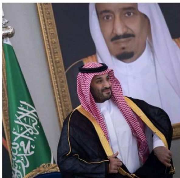
Mohammed ben Salmane s'appête à recevoir le président américain, le 13 mai 2025, à Riyad. Derrière lui, un portrait de son père, le roi Salmane, aujourd'hui âgé de 90 ans.